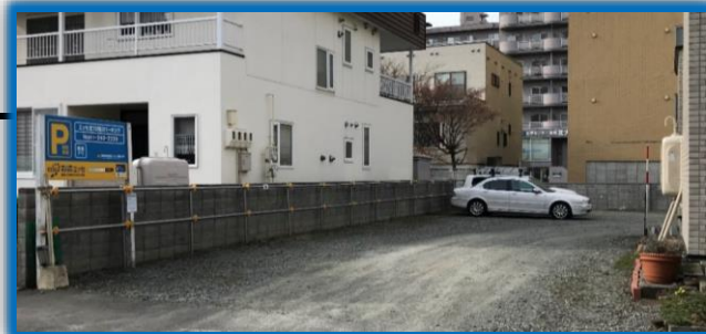
当院裏 北13西2パーキング 写真