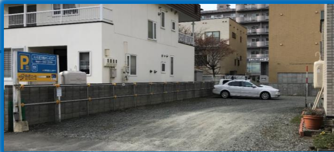
当院裏 北13西2パーキング 写真